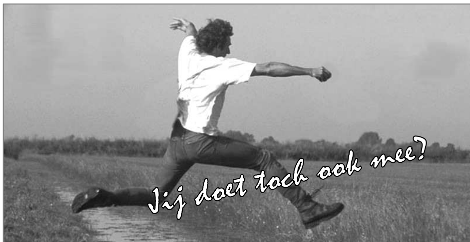
Het scenario 19 juni 2009 aan de Groenslandsloot te Rouveen. Met de hakken over de sloot?